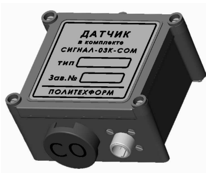
Датчик оксида углерода